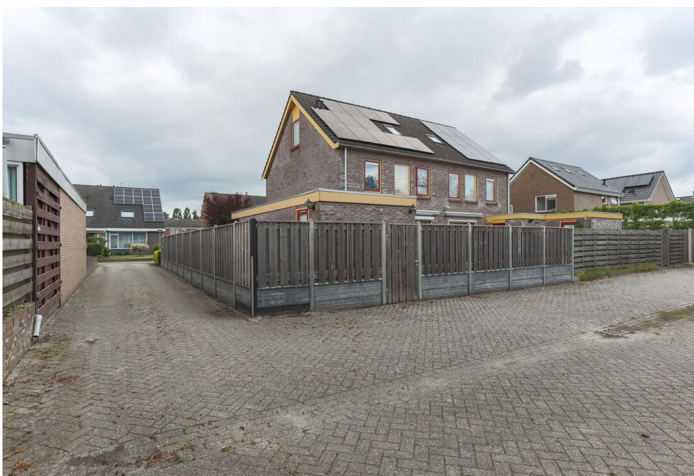
Anjerstraat 5, Nieuw-Buinen